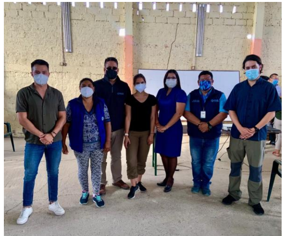
Ilustración 5 Jornadas de capacitación con Renarec y Puce Manabí