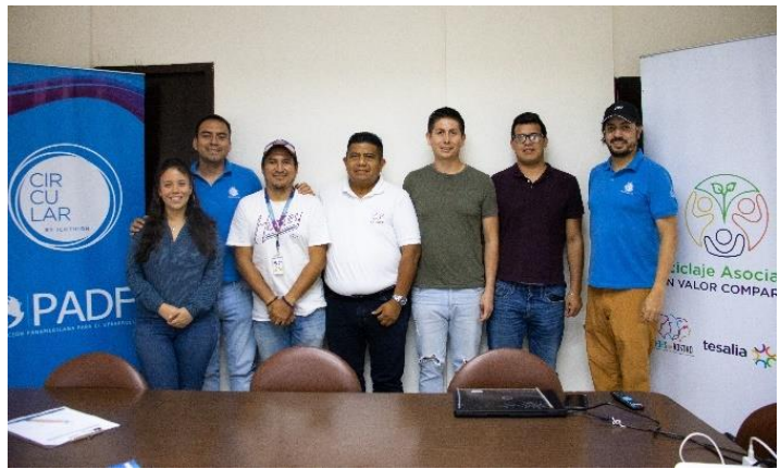
Ilustración 2 Proyecto EcoWork: Mesa Técnica de Reciclaje Inclusivo