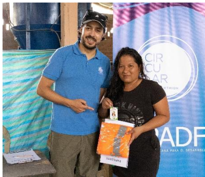
Ilustración 1 Proyecto EcoWork: entrega de implementos, reglamento interno y carnés