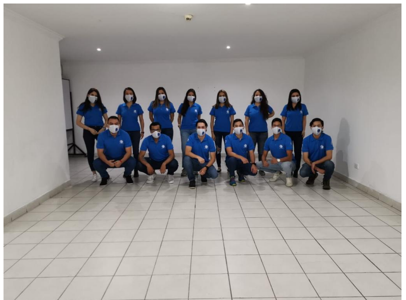
Ilustración 3 Jornada de voluntariado