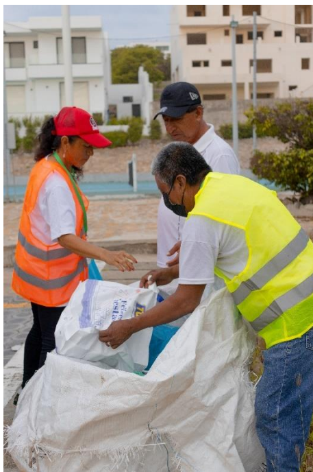
Ilustración 4 Acompañamiento a recicladores de base en recolección en la fuente