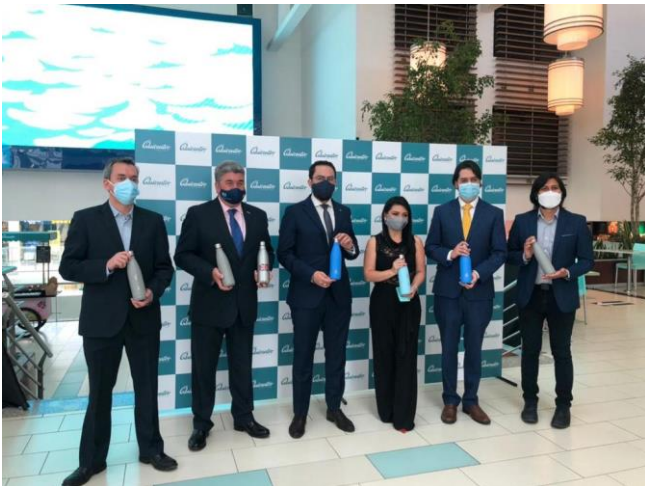
Ilustración 6 Lanzamiento del proyecto Refill Ecuador