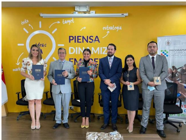
Ilustración 7 Entrega de la Ordenanza Modelo en Gestión de Residuos para ciudades intermedias